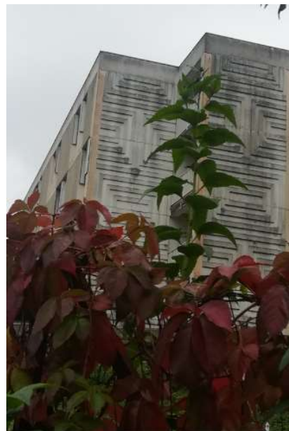
EHPAD de Lalevade vu de la route des Ecoles

Recrutement d'une personne en contrat aidé (prise en charge de 65 %) pour l'école et pour 9 mois.